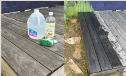
VOR DER REINIGUNG