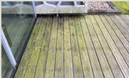
VOR DER REINIGUNG